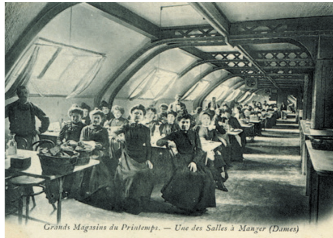
Grands Magasins du Printemps. — Une des Salles à Manger (Dames)

Ce nom, symbole de beaux jours et de renouveau, est en rupture avec l'époque où les enseignes affichent le patronyme de leurs créateurs, leur adresse ou des références à leur positionnement en matière de prix. Jules Jaluzot inscrit son grand magasin, dès sa création, dans une posture de réinvention permanente.